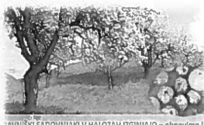
TRAVIŠKI SADOVNIJAKI V HALOZAH IZGINJAJO – obnovimo!